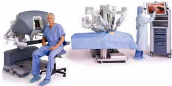
OP Roboter DaVinci®

Auch besteht die Möglichkeit den OP Roboter DaVinci® bei einer Live Demonstration anzuschauen.